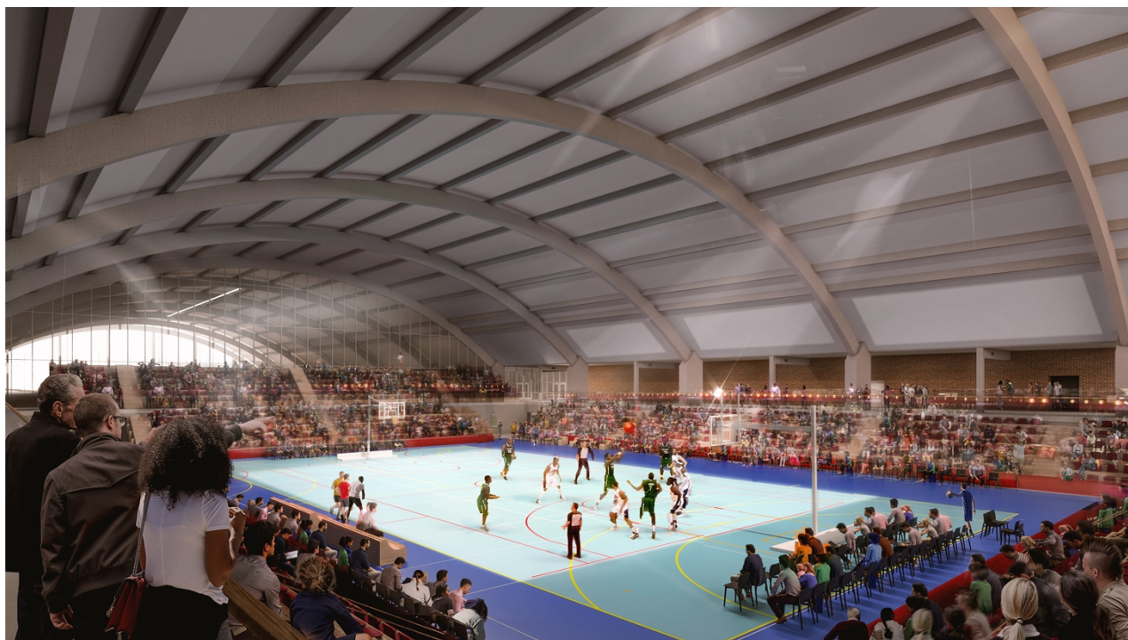
Visionsbild centercourt med åskådarläktare för cirka 2 300 personer, White arkitekter

Den nya anläggningen ska fungera för såväl breddidrott som elitidrott. Anläggningens flerfunktionella disposition skapar förutsättningar för ändamålsenliga lokaler för såväl de stora hallidrotterna som många mindre. Den flexibla lösningen möjliggör större publikevenemang samtidigt som löpande verksamhet i övriga delar av byggnaden.