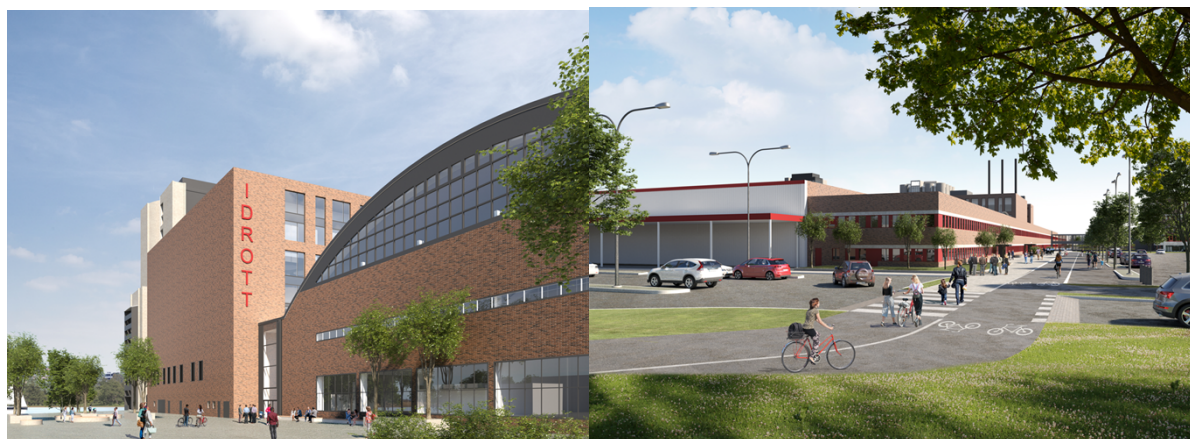
Visionsbilder på norra sekundära entrén till idrottsanläggningen samt gång och cykelstråket längs södra fasaden, Brunnberg & Forshed arkitekter

Det föravtal som tecknats har gått ut då exploateringsavtal inte är tecknat inom föreskriven tid och inte heller avses tecknas mot bakgrund av att planarbetet nu har en ny inriktning jmf med det planförslag som avtalet avsåg. Exploateringskontoret önskar därför teckna nytt föravtal. Bolaget avser återkomma till styrelsen med ett förslag till föravtal när detta är slutförhandlat.