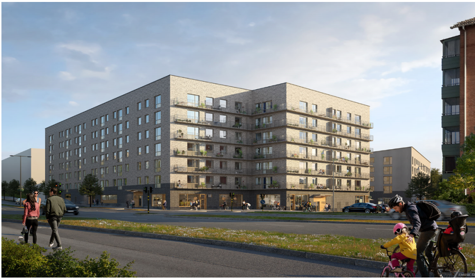
Vy från Magelungsvägen

Bolaget har efter genomförda marknadsanalyser kommit fram till att ovanstående är en lägenhetsfördelning som kompletterar området väl.