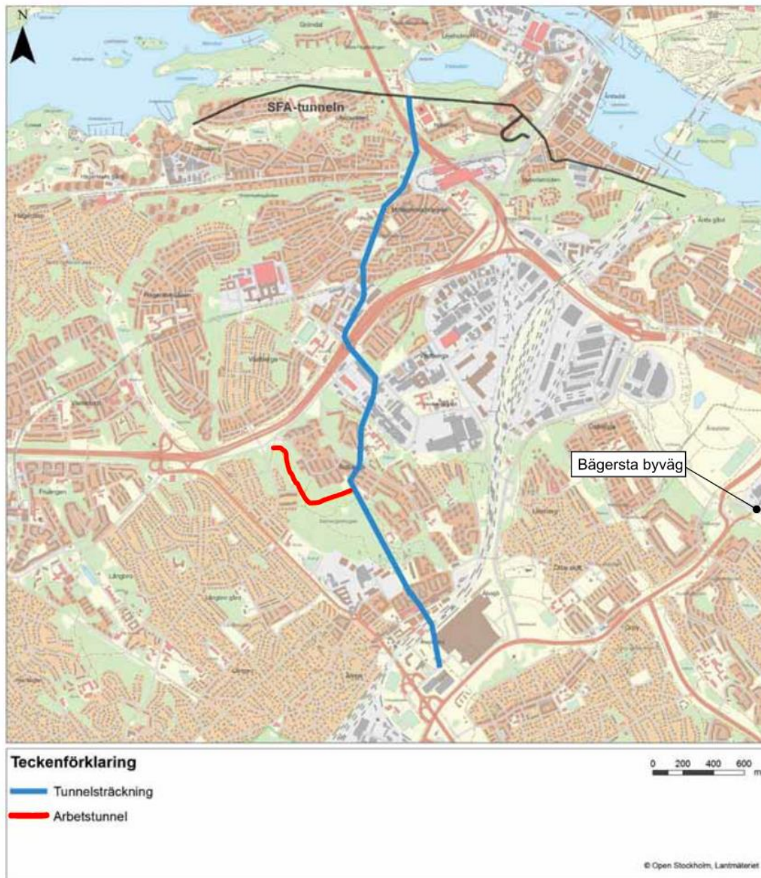
Figur 2 Mälsstunnelns tänkta sträckning samt arbetstunnel. Utloppet från bräddpunkten Bägersta byväg sker via utloppsledningarna från Henriksdals reningsverk till Saltsjön.