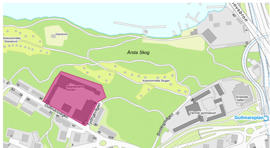
Bilden visar Skanskvarnsskolans placering.

SISAB fick under hösten 2018 en beställning av utbildningsnämnden att genomföra en om-, till- och nybyggnad av Skanskvarnsskolan i Årsta. Vid genomfört projekt ska skolan ha en kapacitet med totalt 960 elever fördelat på årskurs F-9. Denna utökade kapacitet ska möta det ökade behovet av elevplatser i Årsta samt inkludera ett tillagningskök, matsal och en fullstor idrottssal.