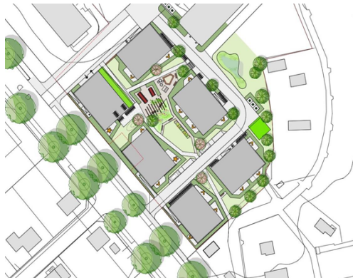
Bild 1. Örtuglandet 1, Åkeslund och placeringen av de nya husen

Nyproduktionen består av sex punkthus med 4 respektive 6 våningar och totalt 96 lägenheter. Under kvartersmarken byggs ett garage med 94 parkeringsplatser som täcker behovet för de 63 befintliga p-platser som byggs bort samt behovet av 31 p-platser för de nya husen. Den nya bebyggelsen kommer att ligga på en yta som idag utgör parkeringsplats, föreningslokal, lekplats och basketplan.