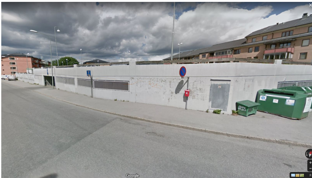
Bild 5. Gatuvy från Åstorpsringen befintlig situation.

Genom satsningen Rättvist Byggnad arbetar vi för att motverka ekonomisk brottslighet, svartarbete och oegentligheter på byggarbetsplatser. Vi samarbetar också med organisationen Håll Nollan för att minska antalet arbetsplatsolyckor.