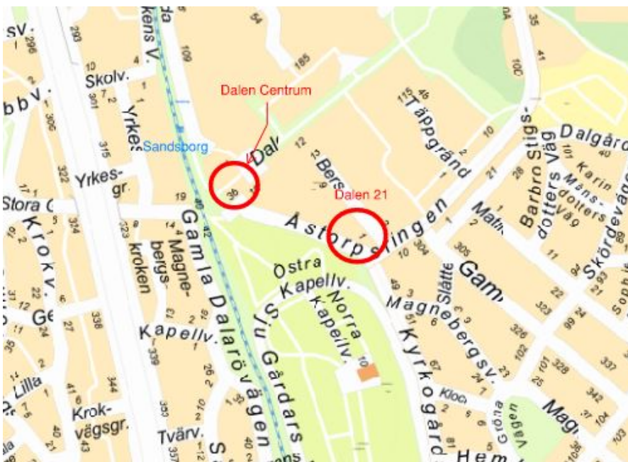
Bild 1. Dalen 21 nära Dalen Centrum och tunnelbanestation Sandsborg.

Projektet avser fastigheten Dalen 21 som ligger nära Dalen Centrum, söder om Stockholms innerstad. Närmsta tunnelbanestation är Sandsborg som ligger längst gröna linjen, se Bild 1. Svenska Bostäder äger Dalens centrum och har ett distriktskontor lokaliserat i Dalens centrum.