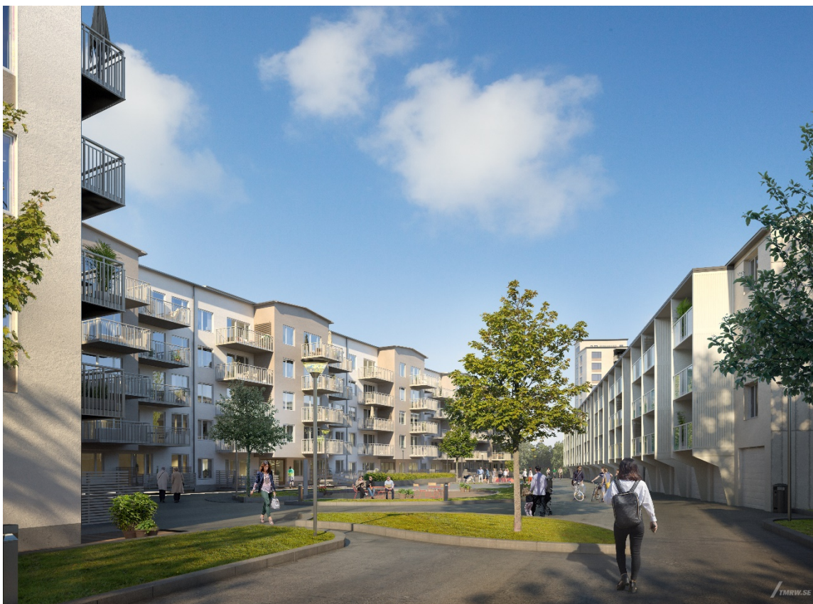
Bild 2. Gård inramad av lamellhuset. Befintlig bebyggelse till höger, punkthuset skymtar bakom.

Antal 55 platser varav 8 st med laddstolpe