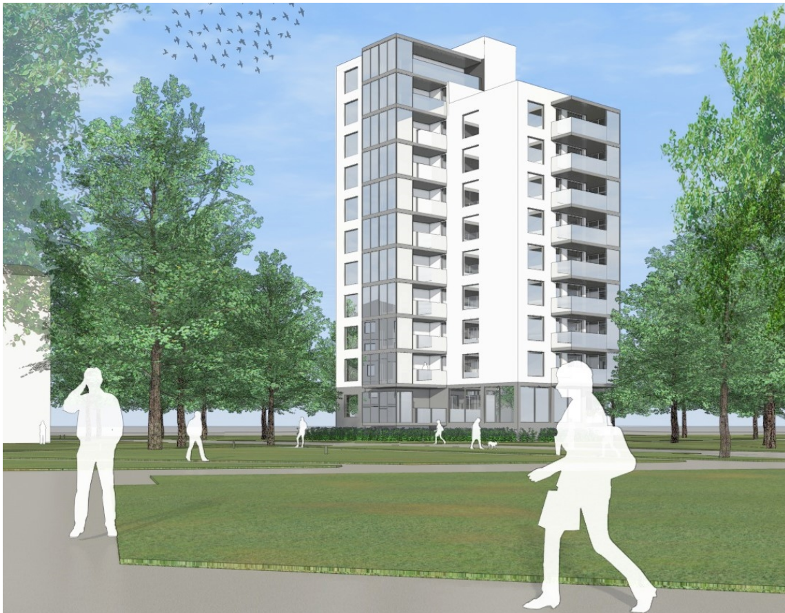
Bild 1 Illustration av punkthus.

Mellan de befintliga bostadshusen finns en nyrenoverad större gård. Den innehåller bland annat bollplan, gräsytor, lekredskap, grillplatser och sittgrupper. Det är nära till Grimstaskogen med utegym och parkvägar. Det är även nära till badplats i mälaren.