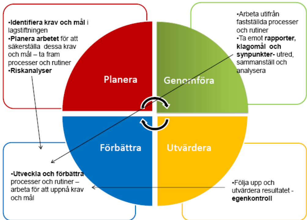
Figur 3 Modell som beskriver ledningssystemet inom elevhälsa

Metoder, processer och rutiner ska årligen granskas för att nå uppsatta mål. Resultat av granskningar ska återföras till medarbetare och andra berörda. Förbättringsåtgärder dokumenteras, analyseras och utgör grunden för reviderade eller nya mål och rutiner.