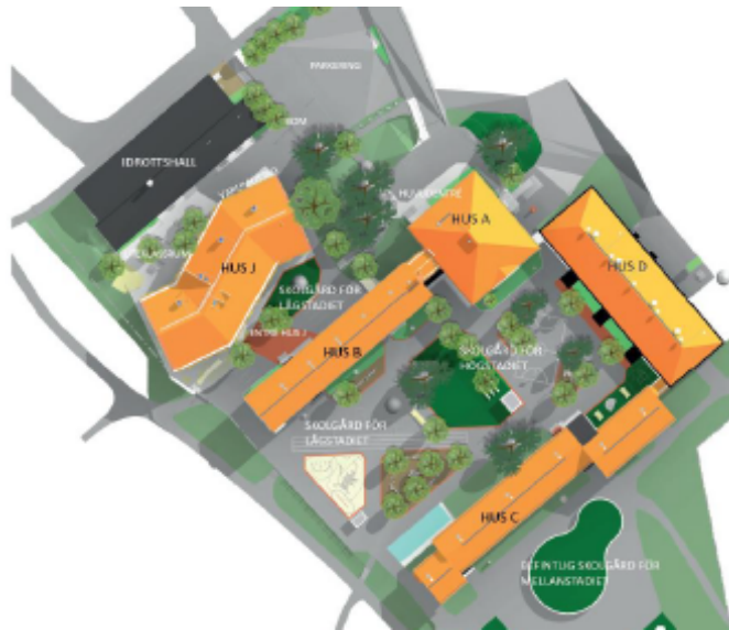
Bild 2 Situationsplan efter byggprojekt vid Bäckahagens skola

I och med de ökade kostnaderna för första etappen pausades projektet av utbildningsförvaltningen i maj 2022. En översyn gjordes för att se om projektet kunde avslutas efter första etappen. Översynen visade att det inte var möjligt. Projektet har även tittat på att skjuta på tidplanen till år 2032, vilket enbart baserat på den förväntade elevantalsökningen skulle vara möjligt men förutsätter att skolan kan lösa delar av sitt idrottsbehov med hjälp av inhyring i närområdet samt att evakueringspaviljongen blir kvar. Merkostnaden för paviljonghyran för ytterligare fem år skulle uppgå till ca 12,5 mnkr exklusive index.