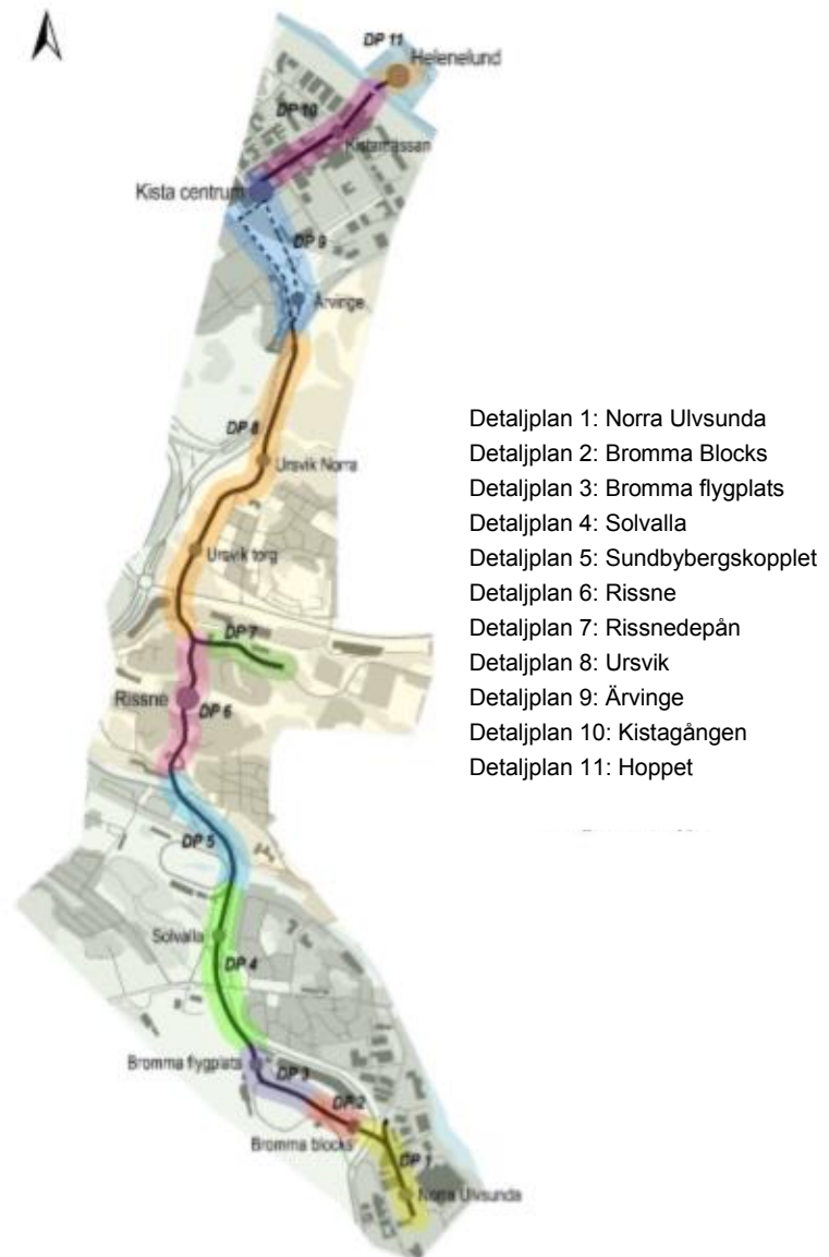
Bild 1. Kistagrenens detaljplaneindelning i Stockholm, Sundbyberg och Sollentuna