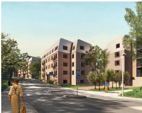
Vy från Gubbkärrsvägen sett från norr

Inom tomträtterna ligger en panncentral från 1950-talet. Panncentralen används idag som tvättstuga och grovsoprum samt som lokal. Den har en särpräglad arkitektur och samtliga fasader har en individuell utformning. Panncentralen är i sådant skick att den är möjlig att bevara och omfattas av skydds- och varsamhetsbestämmelser, vilka innefattar rivningsförbud. I projektet ingår att bevara panncentralen, som bland annat kommer att användas för cykelförvaring.