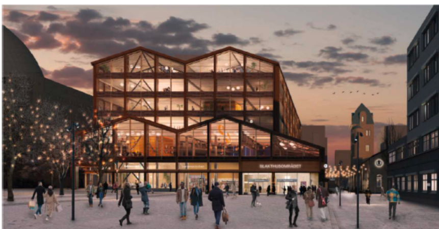
Vy från Norra Entrétorget med tunnelbaneentrén nere till höger