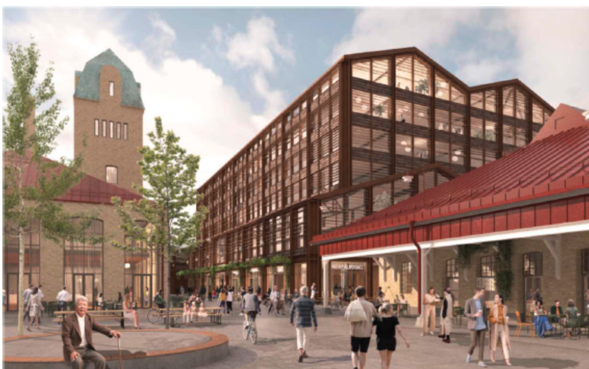
Vy från söder med Rökerigatan i förgrunden