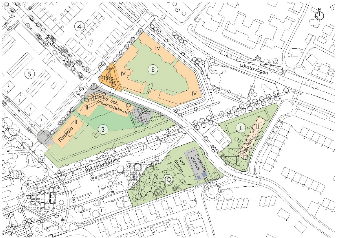
Del av situationsplan för Riddersvik, fil daterad 2019-09-17. Aktuell förskola finns i område nr 3.